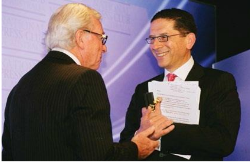
Phát biểu trực tiếp trên sóng truyền hình quốc gia trong vai trò CEO của CPA Australia trong buổi họp bàn về Tương lai Cạnh tranh của Australia của Câu lạc bộ Báo chí Quốc gia.